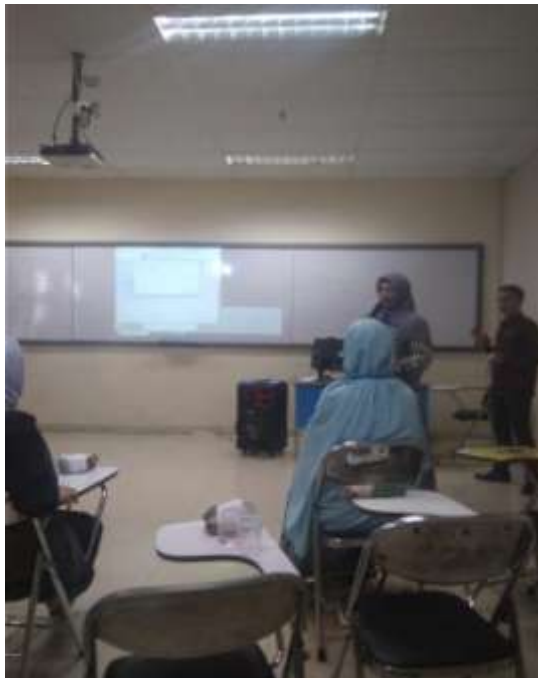
Liputan Acara Lomba Antar Dosen di kegiatan Bina Darma Rector Troph's