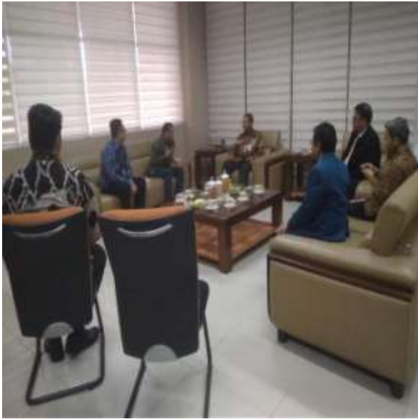
Proses Liputan di Ruang Rektor