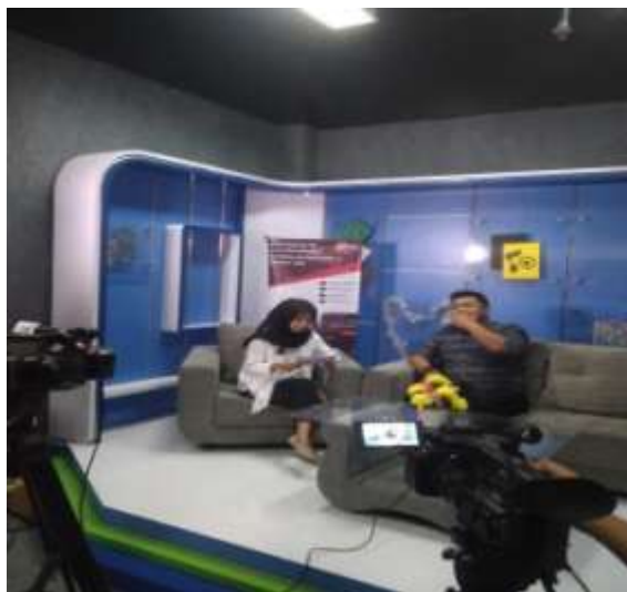
Project Magang di BTV