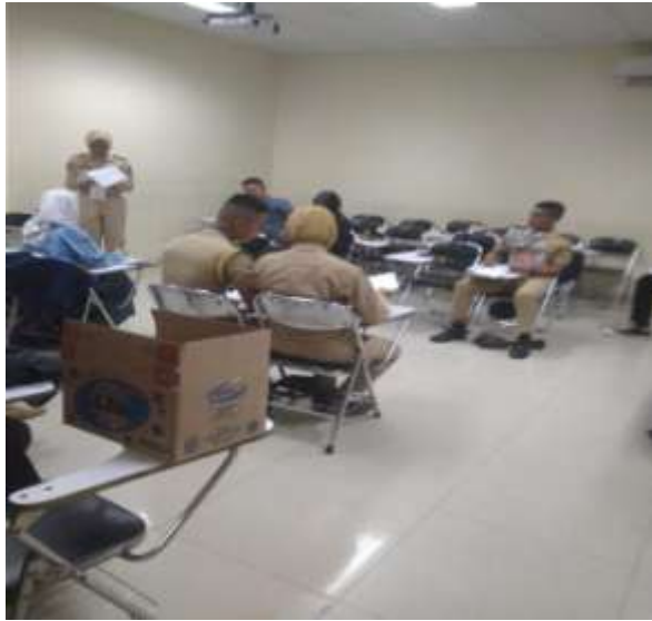
Liputan Acara Debating Rector Trophy's