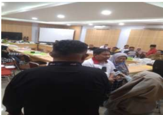
Proses Wawancara Dinas Pendidikan Ristekdikti