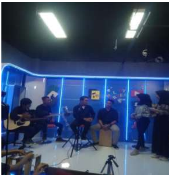
Produksi Acara Melody Corner