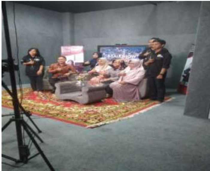
Proses Produksi Acara B-Talkshow