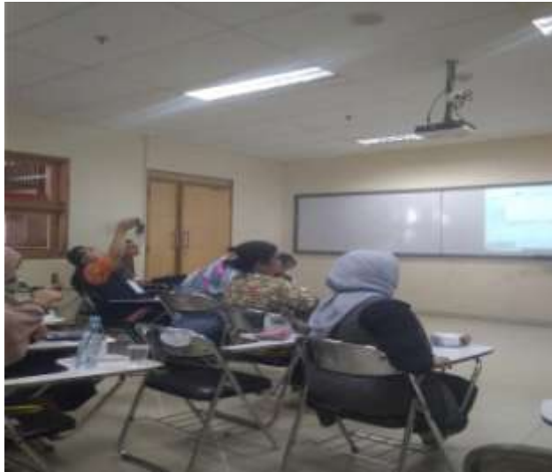
Liputan Acara Lomba Antar Dosen di kegiatan Bina Darma Rector Troph's