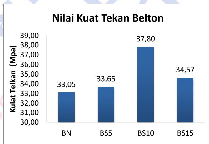
Gambar 2. Grafik nilai kuat tekan beton

Data hasil uji beton pada Tabel 2. dan perbandingan hasilnya dapat dilihat pada grafik Gambar 2. Nilai kuat tekan beton pada beton normal diperoleh sebesar 33,05 Mpa. Hasil ini menunjukkan bahwa kuat tekan yang dihasilkan sesuai dengan standar perkiraan beton normal mix design 30 Mpa yang mengacu pada ACI.