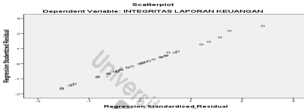
Gambar 2. Hasil Uji Heteroskedastisitas

Hasil uji Heteroskedastisitas dapat dilihat pada gambar 2. sebagai berikut :