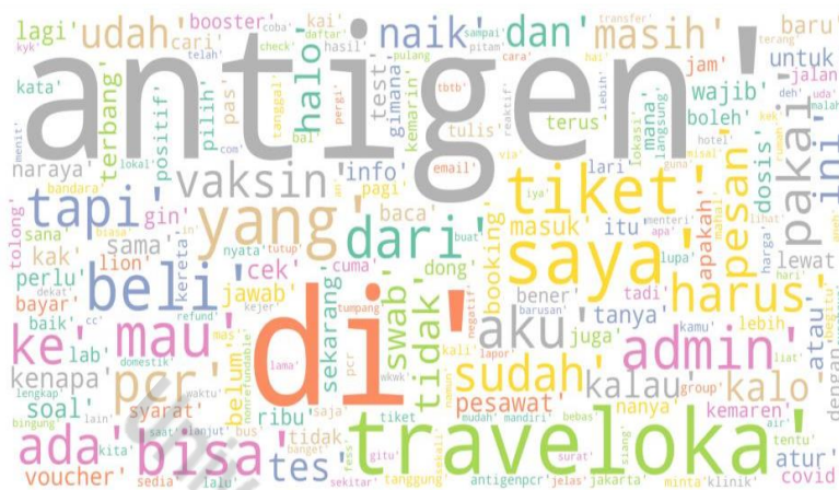
Gambar 3. Wordcloud Negatif