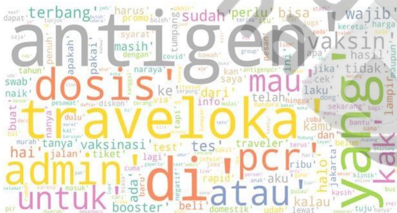
Gambar 2. Wordcloud Positif

Wordcloud dibuat sebagai visualisasi untuk mewakili masing-masing label yang ada. Pada gambar 2 kata pada label positif yang paling sering muncul adalah antigen, traveloka, di, dosis, admin, untuk dan beberapa kata lain yang menunjukkan kata positif pada layanan traveloka antigen dalam sebuah kalimat.