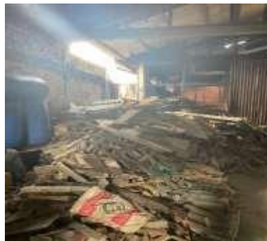
Gambar 1 Pabrik Produksi Kopi Cv. Kopi Biji

Dari observasi awal yang dilakukan pada UMKM Kopi CV. KOPI BIJI berdasarkan data observasi penulis tingkat kadar air pada biji kopi memiliki kadar air sekitar 23% hal tersebut dapat membuat kualitas kopi menjadi tidak tahan lama untuk disimpan dan permasalahan lain yang terdapat pada umkm kopi CV. KOPI BIJI ialah kondisi gudang tempat penyimpanan kayu bakar, dan bahan baku kopi lainnya masih berantakan atau tidak tertata rapi dan berdasarkan data wawancara karyawan di UMKM Kopi telah 7 kali mengalami kecelakaan kerja.